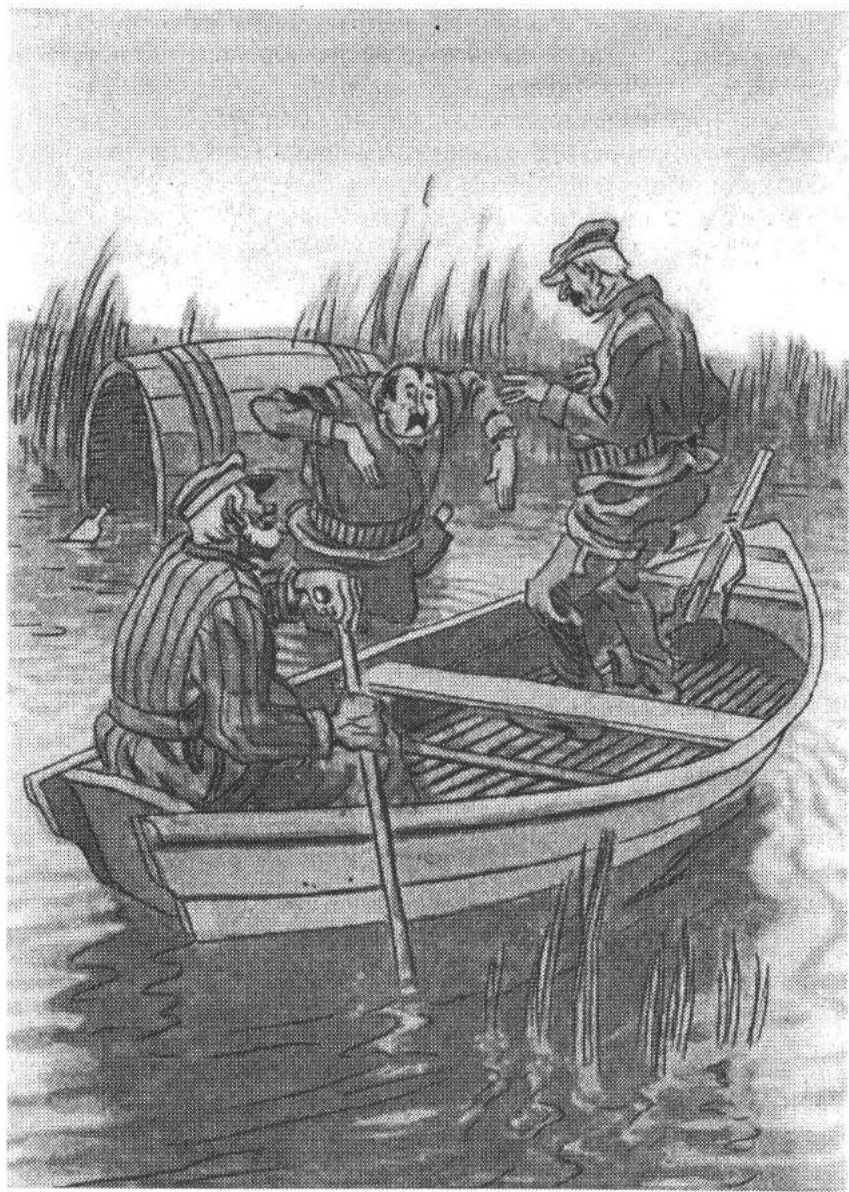
В. Литвиненко. Ілюстрація до збірки Остапа Вишні «Мисливські усмішки»