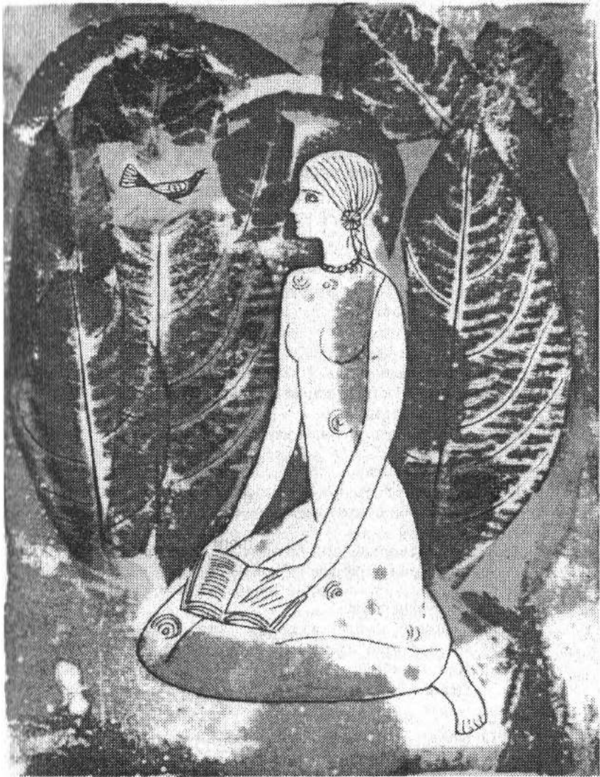
Н. Денисова. Ілюстрація до збірки П. Тичини «Арфами, арфами...»