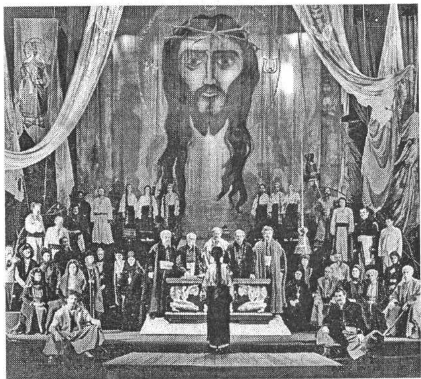
Сцена з вистави театру ім. Марії Заньковецької «Маруся Чурай»